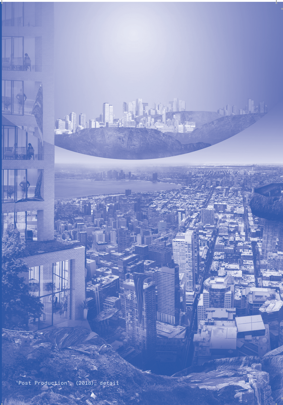
'Post Production', (2018), detail