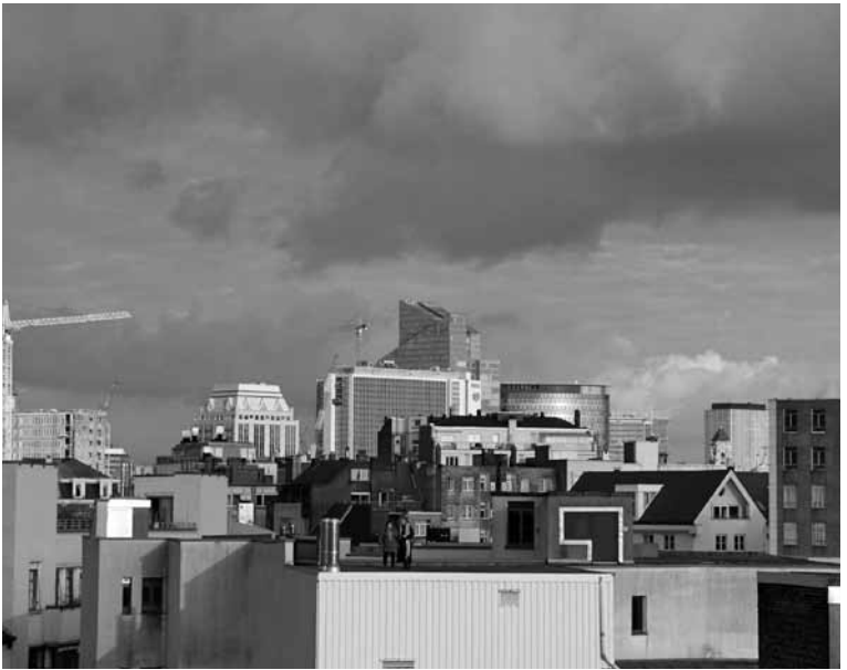
Myriam Van Imschoot, 'Le Cadeau', (2018)

Myriam Van Imschoot (geboren in 1969 te Gent - woont en werkt in Brussel) is performancekunstenaar, actief in het theater en de publieke ruimte. Ze werkt vooral met de stem als drager voor performances. Sinds 2015 loopt de reeks rond de "youyou", waarbij ze met interculturele groepen in Brussel, Oostende, Grenoble en Jaffa voorstellingen maakt(e). Reeds tien jaar bouwt ze daarnaast aan een video-oeuvre met kortfilms en portretten die de thema's uit het performance-werk opnemen. Haar werk werd onder meer getoond in HAU (Berlijn), Filmfestival Experimenta India (Bengalore), Kaaitheater (Brussel), Spectacle Cinema (New York) en De Brakke Grond (Amsterdam).