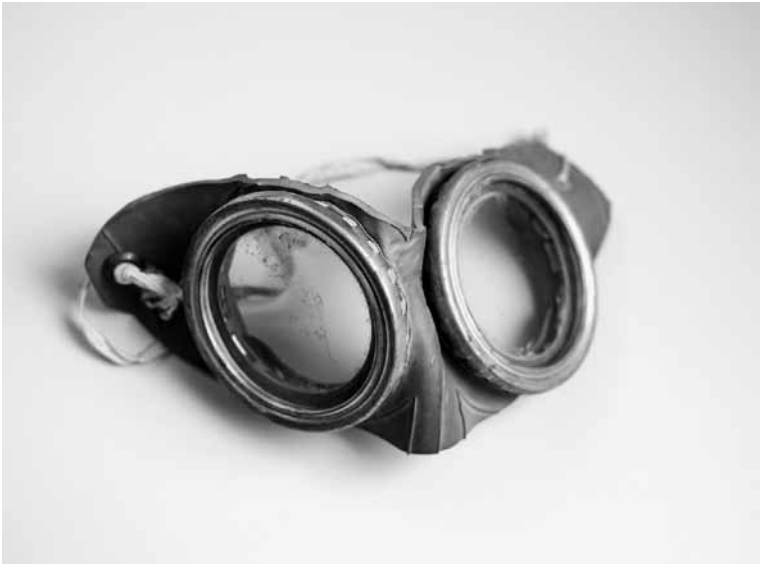
Mashid Mohadjerin, 'Safety Goggles', (2014)

Mashid Mohadjerin (geboren in 1976, Teheran, Iran - woont en werkt in Antwerpen) is fotograaf en beeldend kunstenaar. Ze behaalde haar master aan de Academie voor Schone Kunsten in Antwerpen (KASK) in 2002. Ze ontving verschillende prijzen, waaronder die van World Press Photo in de categorie Contemporary Issues. Haar werk werd internationaal getoond en gepubliceerd in onder andere The New York Times, The Wall Street Journal, Le Monde, de Standaard Magazine, De Volkskrant, BBC online, Artsen Zonder Grenzen, Oxfam en Amnesty Journal. Haar boek 'Lipstick & Gas Masks' is onderdeel van een artistiek research project aan het KASK Antwerpen.