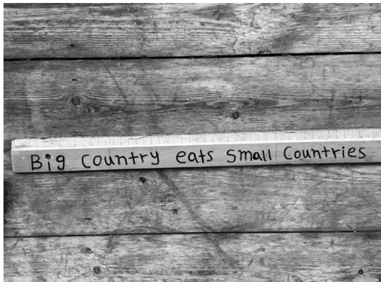
Ermias Kifleyesus, 'Big country eats small countries', (2009)