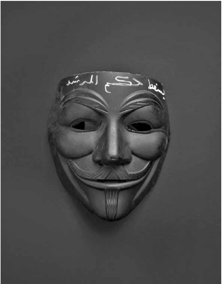
Mashid Mohadjerin, 'Protest painted Black', (2013), courtesy de kunstenaar