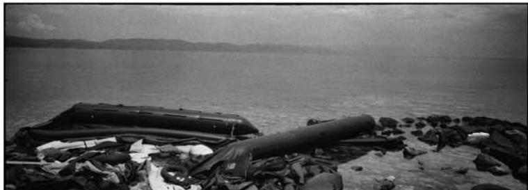
Arkadi Zaides, 'INFINI#1', (2016), foto Yuval Tebol

Net als in ander recent choreografisch en beeldend werk van Zaides – zoals 'TALOS', dat tijdens