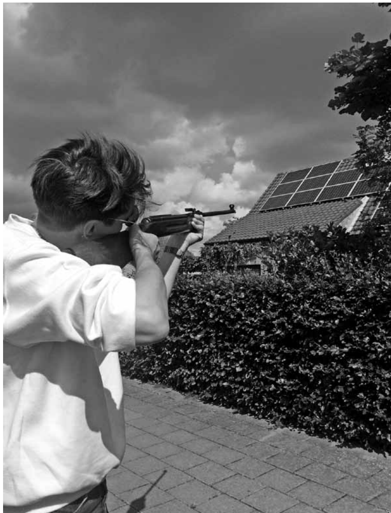
Pieterjan Ginckels, 'SOLAR SAFARI', (2017)